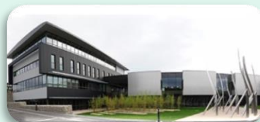
Pôle Formation UIMM Champagne-Ardenne Zone Farman / Reims