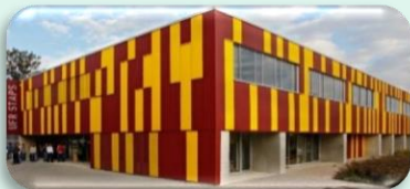
Université de Reims Champagne-Ardenne / EiSINE Campus Moulin de la Housse / Reims

Les enseignements sont dispensés au sein des écoles partenaires de l'ITII Champagne-Ardenne :